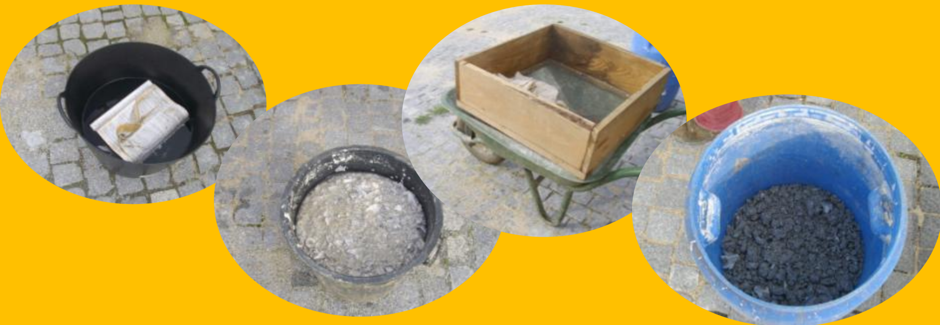
Pasta de papel reciclado (EM SUBSTITUIÇÃO DA PALHA TRADICIONAL)