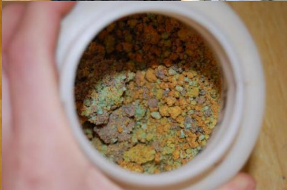
PREPARAÇÃO DOS PIGMENTOS PARA COLORAÇÃO DAS PEÇAS