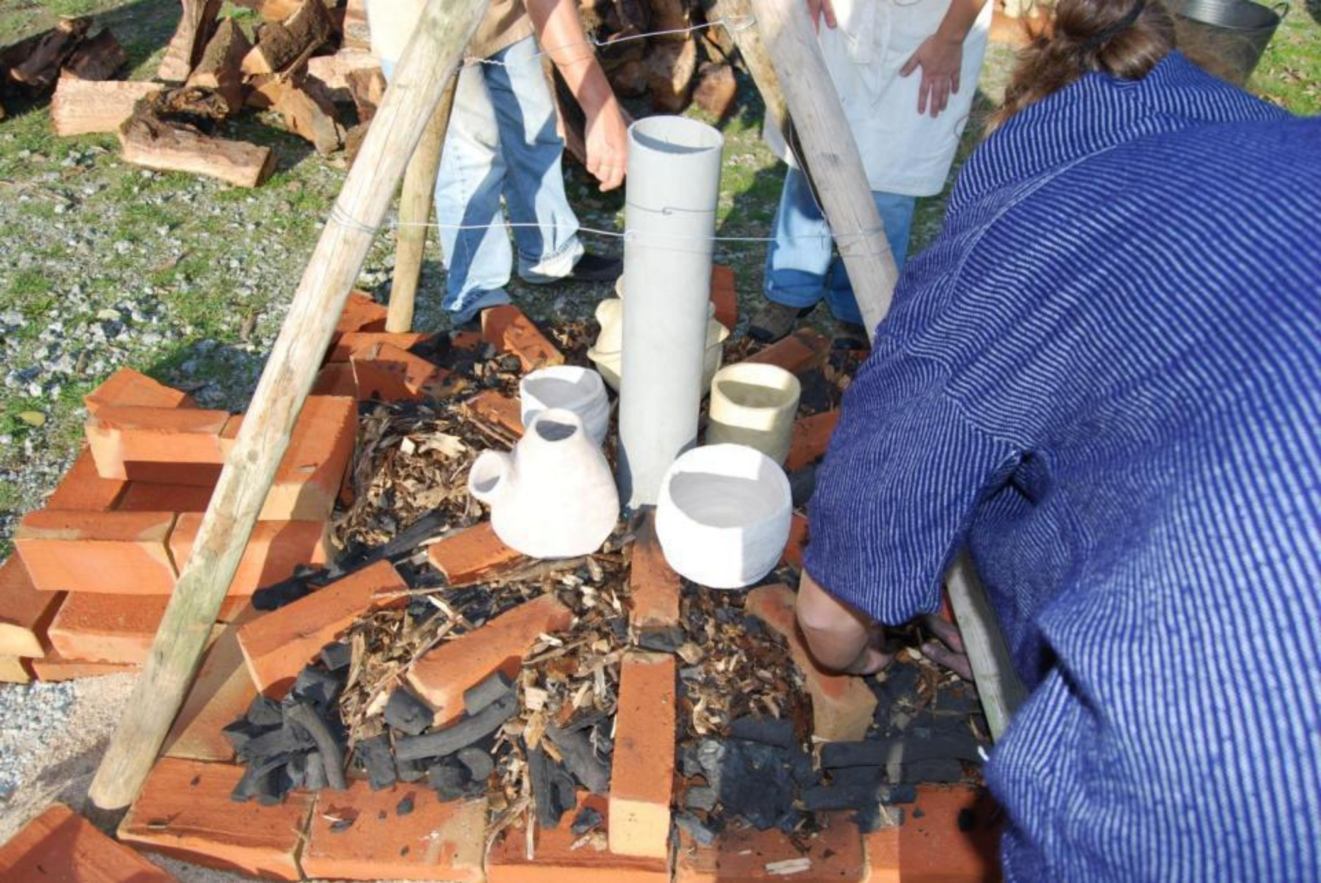
COLOCAÇÃO DAS PEÇAS NO INTERIOR DO FORNO PARA COZIMENTO